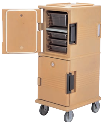
②カムカート (フードパン用) UPC800

外寸:520×690×H1,145 内寸:340×540×H355×2 重量:40kg キャスター5" (φ127mm) ×4輪 (自在ストッパー付×1・自在×1・固定×2) フードパン・カバー収納数 (別売) 深さ: 1/1サイズ 1/2サイズ 1/3サイズ 65 8枚 16枚 24枚 100 6枚 12枚 18枚 150 4枚 8枚 12枚 200 2枚 4枚 — ※カバーをセットしても収納可能です。