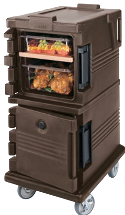
①カムカート (フードパン用) UPC600