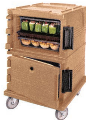
③カムカート (フードパン用) UPC1200

外寸:520×690×H1,370 内寸:330×545×H485×2 重量:43.5kg キャスター6" (φ152mm) ×4輪 (自在ストッパー付×1・自在×1・固定×2) フードパン・カバー収納数 (別売) 深さ: 1/1サイズ 1/2サイズ 1/3サイズ 65 12セット 24セット 36セット 100 8セット 16セット 24セット 150 6セット 12セット 18セット 200 4セット 8セット —